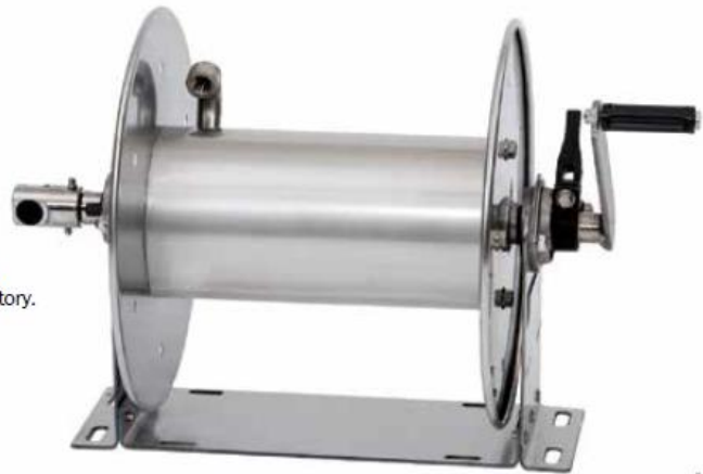
Standard configuration shown with mill finish